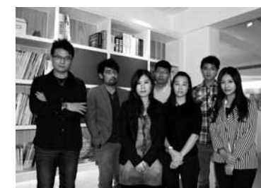
IPIIN Design Group

邑品國際室內裝修設計有限公司 現任 | 邑品空間設計 設計師 空間設計必須對應人，所有的創意都不能偏離使用者，而將屋主的喜好、生活需求、未來彈性加以揉合，才能打造專屬的美感與空間性格。