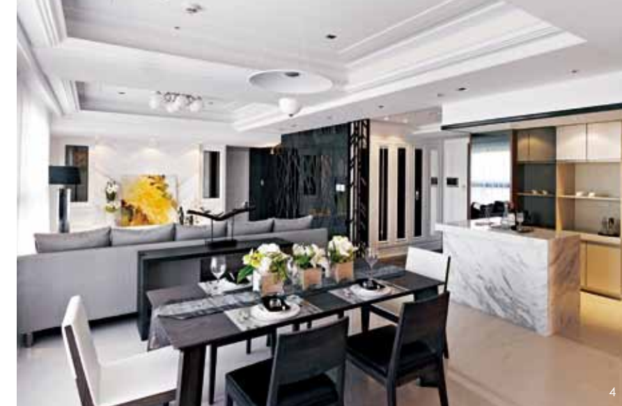
1.自玄關鐵件屏風向電視牆延伸的墨鏡立面，點綴噴砂線條隱喻森林意象，並將多處動線開口整合其間。 2.整個開放空間利用家具擺設與分區天花板造型輔助界定，一點透視的景深展現豐富層次。 3.玄關側牆以明鏡搭配古典線板營造生動表情，同時增加進門後的開闊感。 4.由餐廳望向客廳，電視主牆溫潤的光感與兩側開窗的手法，創造深遠的端景效果。 5.餐桌端景混搭古典線板、灰鏡、H型鐵件等衝突材質，展現細節工藝的精緻。